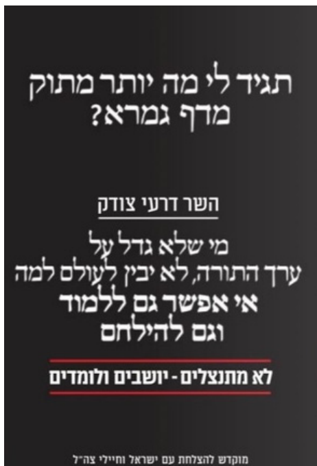
מוקדש להצלחת עם ישראל וחיילי צה"ל

בחלק מהעיתונים המכונים "עלוני השבת", המחולקים בבתי הכנסת של הציבור הדתי לאומי, מפורסמת לאחרונה ההודעה המצורפת לעיל. מה עומד מאחורי מסריה? איזה רגש היא בעיקר מעוררת? אלו תהיות היא מציפה? למי היא בכלל מיועדת?